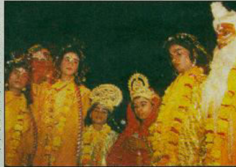
विशिष्ट अंदाज में होती है बहराइत की रामलीला

बहराइत, 16 सितम्बर : सन्नि अर्जन व प्रदर्शन की आँधी के बीच बहराइत की रामलीला अपने विशिष्टता बनकर हुए हैं। रामलीला का मंचन एक शताब्दी से अधिक पुराना है। विश्व के इतिहास में ही नहीं अपितु भारतीय स्वतन्त्रता संग्राम के इतिहास में भी यहाँ की राम लीला खास अहमियत रखती है। नपक कानून तोड़ने से लेकर विदेशी यन्त्रों को जलाने से यह चरम हिस्सा लिया या जिसका प्रेय महात्म्य गंधी की याता है। लीला के मंचन के माध्यम से राम लीला कमेटी ने पारलक्ष्यता के विरुद्ध ससर्न की शक्ति को विकसित करने का प्रयास किया, जो अन्त में ही के बीच सामूहिक उल्लास के बीच मौजूद है।