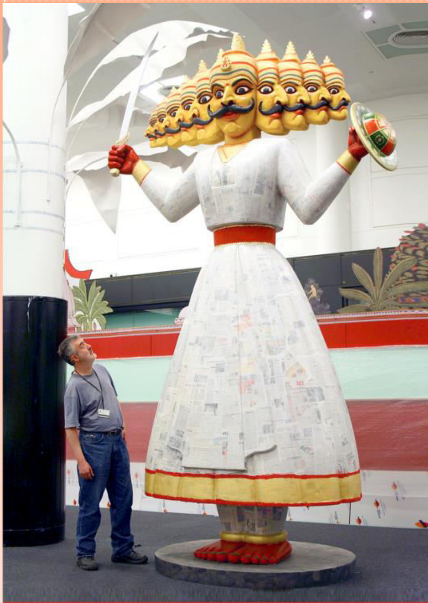
Model Of Ravana Installed In The British Library's Pearson Gallery ( London )