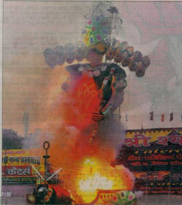
दिल्ली के एक रामलीला मैदान में धू-धू कर जलता बुराई का प्रतीक रावण।

डोली भूमि गिरत दसकंधर। छुभित सिंधु सरि दिग्गज भूधर ॥*