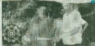
रावण का अट्टहास करने वाले कर्कर की सम्मति इसी उत्सव का प्रमुख कार्यक्रम है।